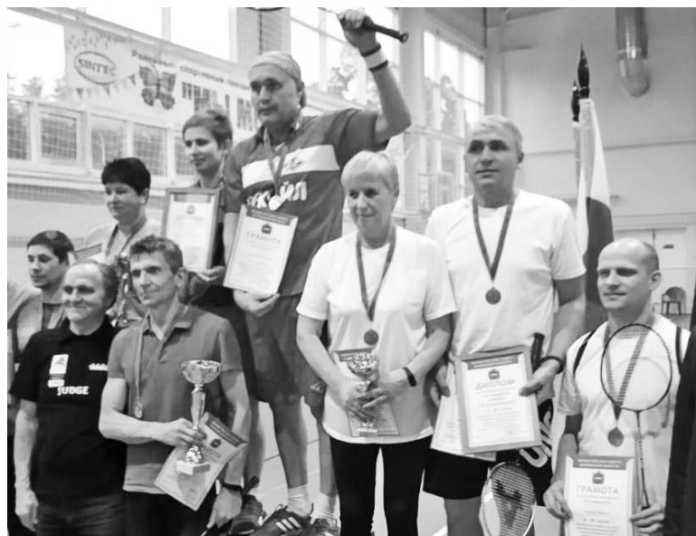
Думиничская сборная по бадминтону на пьедестале почёта среди других призеров соревнований.

В прошедшие выходные сборные Думиничского района завоевали призовые места на областных соревнованиях.