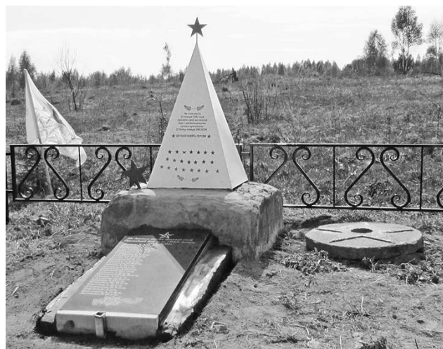
Памятник на месте гибели лыжников-чекистов.